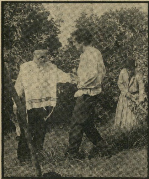
בן-גוריון הצעיר בפרדס — לסרט תעמולה שובניסטי

האשם, מהחה את הצרימה הגדולה ביותר של הסרט.