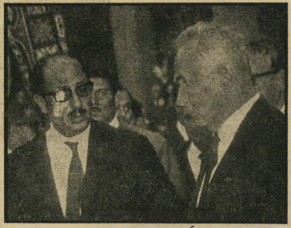
קוסיגין וסאדאת (בהלוויית נאצר)

ל זה היה צריך להראיג מאד את האורח הישראלי. אולם הוא עקב אחרי כל המישחק באדישות. הוא אמר לעצמו: "דעת-הקהל בישראל רוצה כולה בהמשך הספ- קת-האש. אם גם המצרים, האמריקאים והסובייטים רוצים בכך, בחדאי ימצאו איוושהי דרך לצאת מן הבוץ."