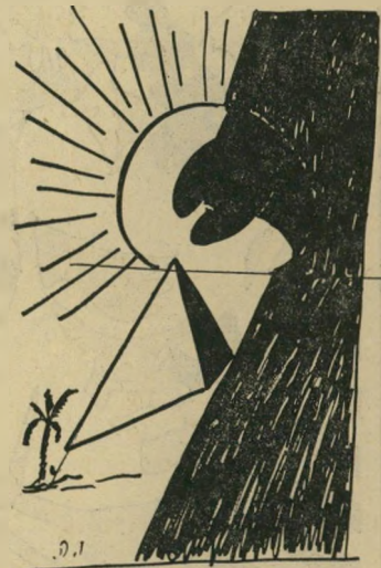
ליקוי חמה במצריים