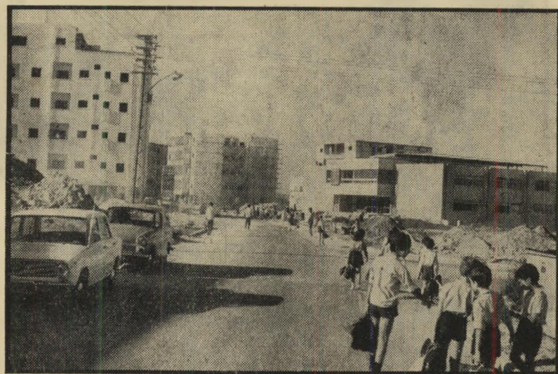
ילדים בדרך לבית-הספר "יצחק שדה" מי אחראי לבטיחות?

שבוע שעבר, נחל הצלחה נוספת ב- שאיפתו זו.