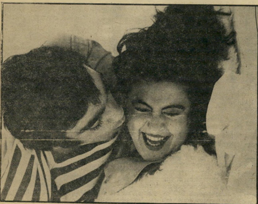
4. התרוממות (ישראל)