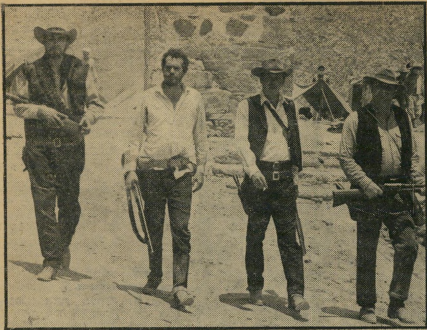
4. חבורת הפראים (ארצות-הברית)