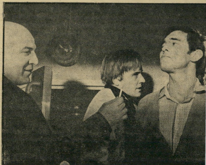
3. בשרות הוד מלכותה (בריטניה)