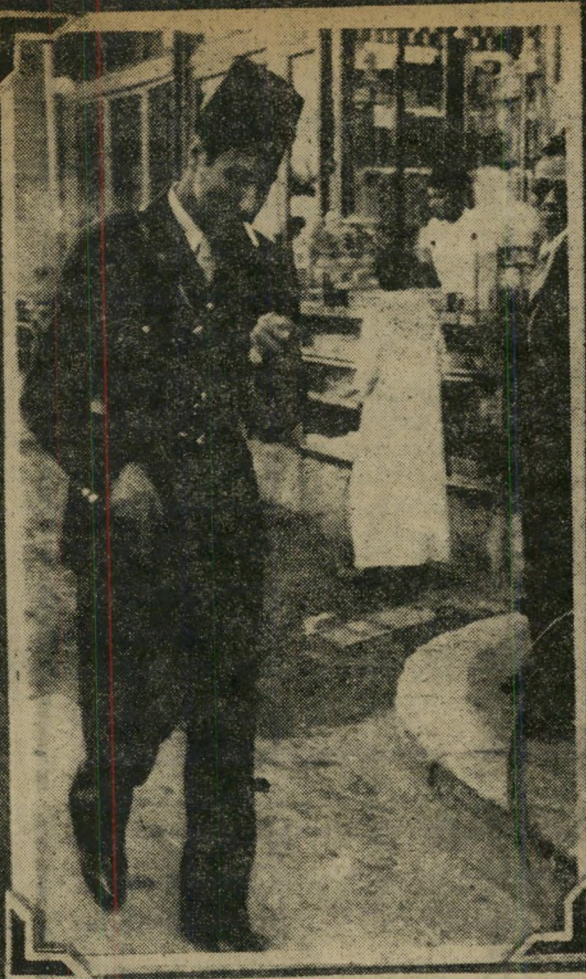
במדי סגן-מישנה מצית סיגריה „וחולם שאני מצית מהפכה.“