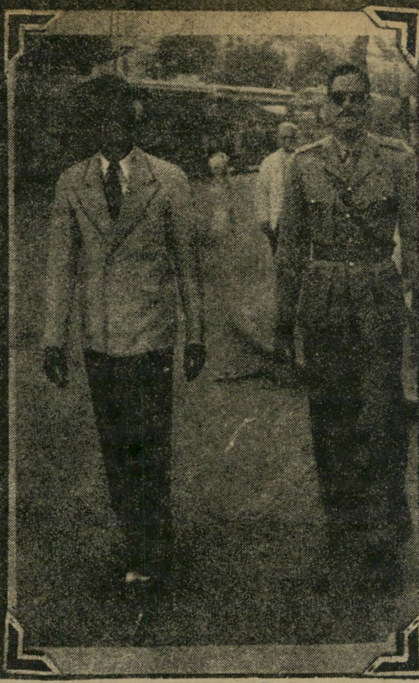
מיקטורן לבן, מכנסיים אפורים — גבר מצרי צעיר רגיל לחלוטין.