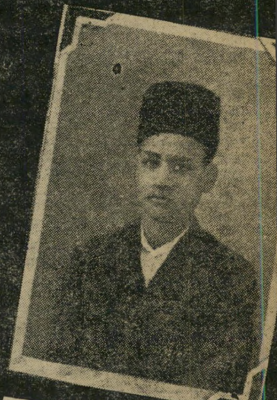
נראה בסיום לימודיו בקהיר.