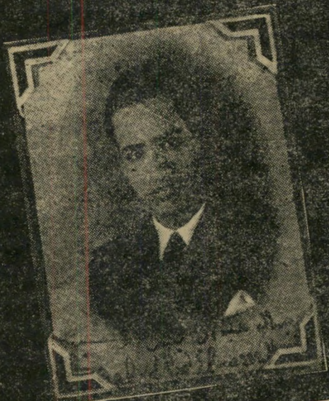
תמונה הצמודה לבקשתו ל- התקבל כסטודנט למוסד חתימתו

תמונות אלה מציגות את נאצר האדם, לפני שהפך לסמל בעיני העולם הערבי.