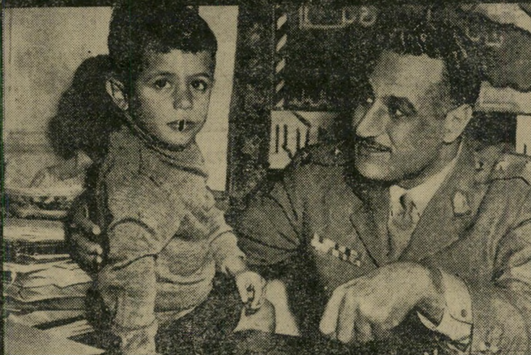
נאצר בחברת בנו הצעיר, שהוא כיום קצין בצי המצרי.