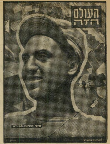
איש השנה תש"א העולה החדש