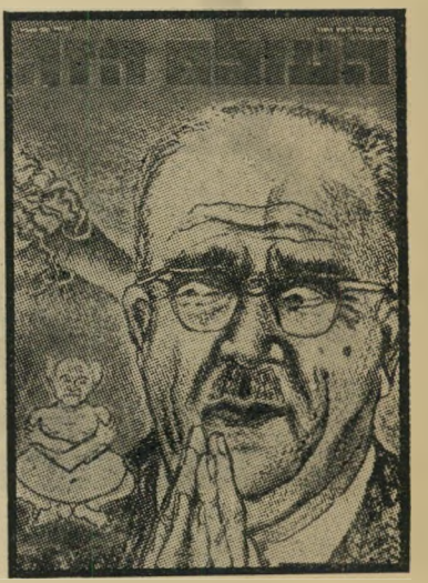
איש השנה תשכ"ד יורש אשכול