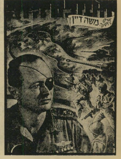
איש השנה תש"ח מצביא סיני ד"ן

נבחר מבין ההכחות הבאות: • האיש השפיע ביותר על מדינת ישראל. • האיש המסמל בדמותו יותר מכל אדם אחר את מצבו של העם בישראל בשנה שחלפה. • האיש הקשור למאורע שהשיפע ביותר על ישראל. ★ ★ ★ בימים האחרונים, למשל, נוספו לרשימת המועמדים לתואר איש השנה, מיספר ניכר של אנשים שעמדו במרכז החדשות. ביניהם אפשר היה למצוא את ליליה חאי'לה, חוספת המזוסים שנעצרה אחרי שניסתה לחטוף מטוס, "אלי על", ושוייצגה את המאבק של ארגוני הטירור הפלסטינים בישראל; את הר"ר ג'ורג' חכש, מני היג, החזית העממית לשחרור