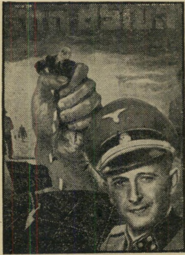
איש השנה תש"ז רכז שואה אייכמן