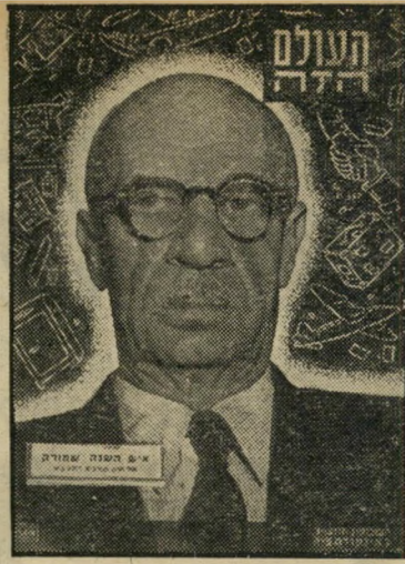
איש השנה תש"ב מבקר הסוכנות שמוראק