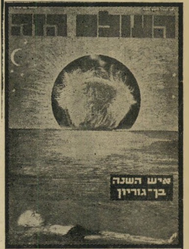
איש השנה תשכ"ג מתפטר בן-גוריון