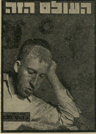
איש השנה תש"ח חתן תנ"ך חכט