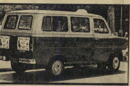
מונית עם שלטי פירסומת החזטה אישית של עזר וייצמן

אחד מצעדיו האחרונים של עזר וייצמן כשר תחבורה היה חיסול עול מזור, ש-התבטא במאבק שהתנהל בחמש השנים ה-אחרונות בין קאופרטיב דן לבין אירגון