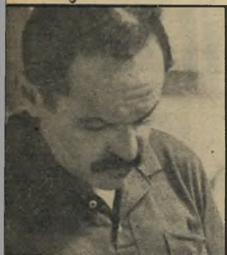
הסופר הנודע בנימין תמוז, עורך המוסף ה"ספרותי של היומון הארץ, מאזין להרצאה.

הבעה אופיינית לרבים מן המאזינים למורת הגורו בישראל, שמשעותיה: אמונה, תקווה, רגיעה.