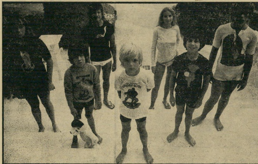
ברונסון, אשתו וחמשת ילדיהם - למרומי הוליווד

מכוור, פקסי וזועם. יום אחד, כש הגיעו מים עד נפש, החליט כי מוטב שיהיה פש מזלו באירופה, שם סוגדים הבמאים הצרפתים הצעירים לסרט-פעולה האמריקאיים בהם הוא נהג להופיע. הוא צדק. רק הגיע לצרפת, צורף מיד לשלום לידי. מאז שכרו הולך ועולה. הוליווד עצמה מגלה לפתע עד כמה הוא מוכשר (ואת אומרת