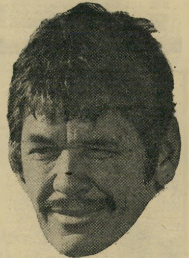
כוכב ברונסון - ממעמקי המיכרה

כציפורניים ובשיניים. במשך שנים רבות מאוד חשב גם צ'ארלס ברונסון שזו עצמו שליוותר מזה לא יוכל להגיע.