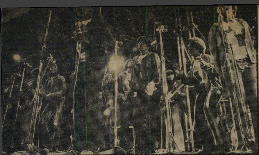
ילדי הרלם מקהלת קילות הרלם בפעם רי המקהלה לבושי הגינס מיזים בגיל 10-17, עמדו להופיע בפאריס לאחר ה