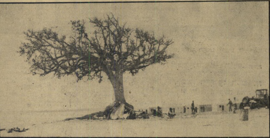
הכפר המוקם בפיתחת-רפיח זה קטן —

ליד אשל עתיק יומין, בלב המדבר ה- שומם, עומדים מספר בתים קטנים. זה כל מה שהעין רואה.