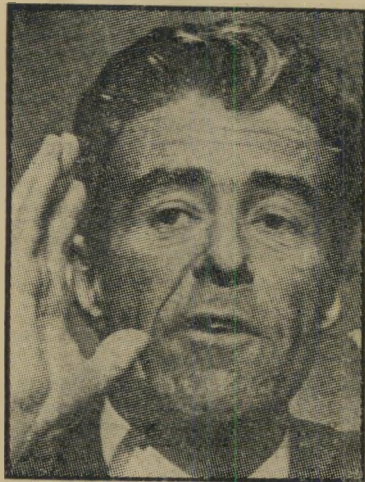
ציר סארבן-שריבר סדק קטן, ועוד סדק קטן

דה-גול הלך, אך המשטר הגוליטי נשאר — עובדה מטרידה ביותר לגבי כל ישראל, האלי, הזוכר את המיראזים. ב-20 לספטמבר יזכר מהם סיכוייו של המשטר הגוליטי כטי להמשיך ולהישאר בשלטון. כיום זה ייערכו במחוז בורדו, בחירות לקביעת ציר המחוז לפרלמנט. שני מתחרים עיקריים נאבקים על קולותיהם של אזרחי המחוז: הראשון הוא לא פחות מאשר ראש ממשלת צרפת, ז'אק