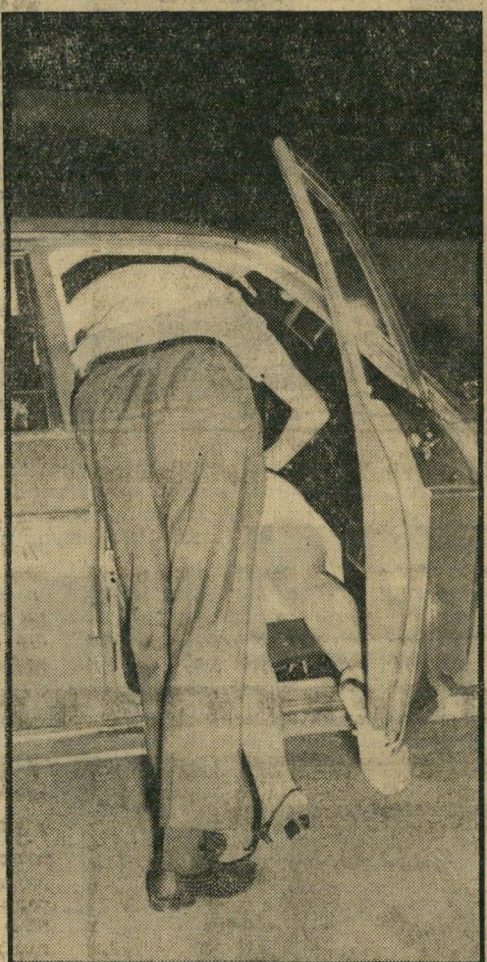
יום שישי, 21 לאוגוסט:

צעירה בת 16, ששמה נאסר לפירסום, מבלה עד חצות בדיסקוטק "חצות" בפתח-תקוה. אין לה כסף לחזור לפיתה ברמלה, בשעת לילה מאוחרת זו. צעיר שבילה גם הוא במקום מתנדב לתת לה טרמפ הביתה. במקום זאת, הוא מביא אותה ל-דירה אלמונית בראשיהעין. כך מתחילה פרשת אונס מזועזעת, שבמהלכה אונסים 14 צעירים את הקטינה, במשך שלושה ימים תמימים, כשהם מח-ממים אותה בכוזרי שינה ובסמים. בתמונה: שניים מן החשודים באונס, אחד מהם מסתיר את פניו מפני המצלמה, מועלים אל נידת המשטרה.