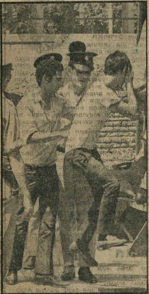
יום שני, 17 לאוגוסט:

נעצרו 2 צעירים החשודים ברצח הנערה מראשיהעין