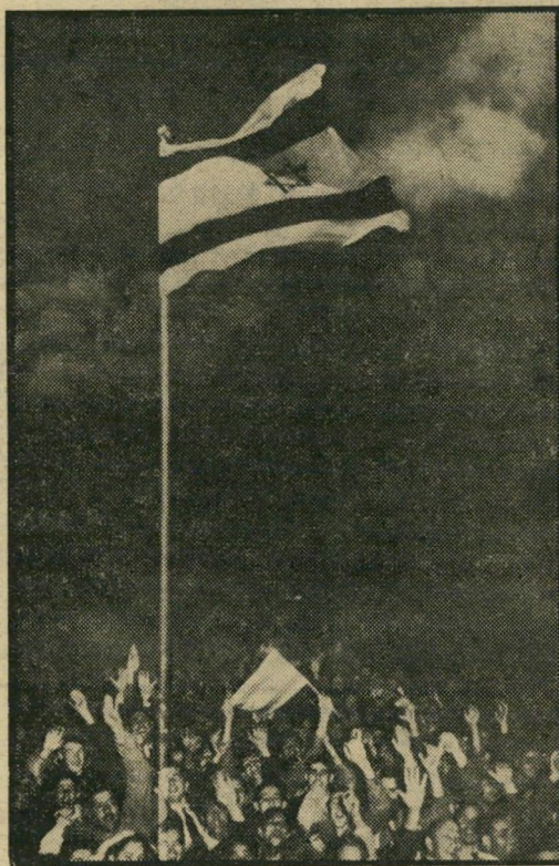
תל-אביב, 29 בנובמבר 1947

המדינה שהובטחה לנו היתה קטנטנה. לא נכללו בה עכו ונצרת, רמלה ולוד, אשקלון ובאר-שבע, הגליל המערבי וחבל לכיש ואזור ניצנה. במדינה קטנה זו היה רק רוב עברי קטן, ומיעוט ערבי גדול מאוד.