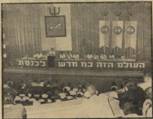
הכנס הראשון — אוגוסט 1965

לפני חמש שנים בדיוק — במחצית השנייה של אוגוסט 1965 — עשה העולם הזה מעשה חסרת תקדים בעולם. יש תנועות פוליטיות רבות בעולם שהולידו עיתונים. אולם זו הפעם הראשונה הוליד עיתון — ודווקא עיתון בעל תפוצה המונית, הכולל חלקים מדיניים ובידוריים — תנועה פוליטית. הנסיבות היו מיוחדות, כמו המעשה עצמו. הדחיפה המיידית נית על ידי מדינה שהיתה מכוננת נגד העיתון — הקנוניה של חוגי