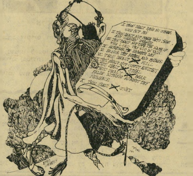
אשה דין כפי שרואה אותו המהדורה הביירונית של ה"דיילי סטאר": משה רבנו בדמות משה דיין מחזיק את לוחות הברית והיכן שכתוב "לא", ה"לא" נמחק.

בוזה לא תמה פרשת ה"מילים. בתום הוויכוח נאם אבא אבן , והוכיח כי בתרגום ה"צרפתי והספרדי אין הבדל בין שתי המילים האנגליות להכ"ה. קרא בגין בליגולג כרמזו