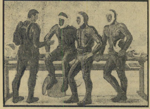
טייטסים סובייטיים לפני קרב

אזרחי ישראל לא יכלו לדעת מה אמר אבנרי באותו דיון כהקדמה