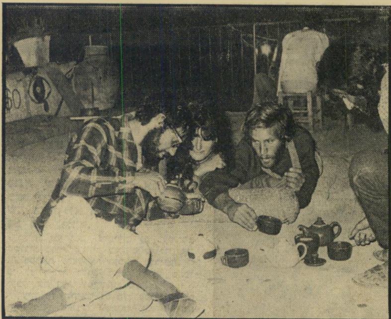
אורחים ב"בית התה" בצפת -

לטובה, החליט לא לשלוח אותו לכלא, לתת לו במקום זאת הודמנות נוספת. החלטה זו לא נראתה לתביעה. היועץ המשפטי לממשלה עירער עליה. בית-המש' פט העליון דחה את העירעור, הסכים לדעת בית-המשפט המחוזי שיש לתת להיפי הצעיר הודמנות נוספת.