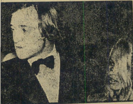
ברברה לורד וריצ'ארד האריס

מנהלים רומן • שחקן הקולנוע שהסריט לפני כמה חודשים בארץ את הסרט בלומפילד, ריצ'ארד האריס וברברה לורד. השניים מתכוננים לבוא לי-