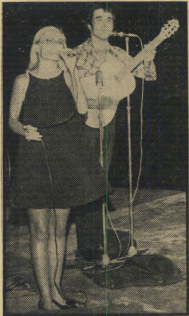
אילנית עם שתי רגליים

עד עכשיו היה ידוע כי לזמרת אילנית יש קול יפה והופעה נאה. והנה, בשבוע שעבר, בא עיתונכם (העולם הזה 1717)