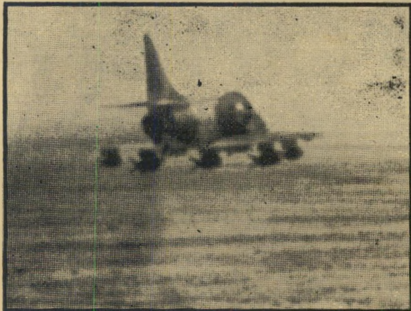
"סקייהוק" בשעת תקיפה

אישור מעין זה פתח בפני ניומן את כל הדלתות שלא נפתחו