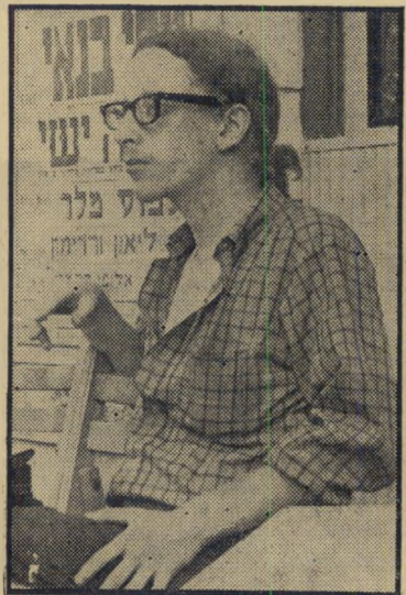
ציר טברסקי רוצים שלום — כדי לעלות

שאלה זו ריחפה במשך שישה ימים על כינוס ההתאחדות העולמית של ה-סטודנטים היהודיים, החגים, שנערך הש-בוע בערד. הבעיה היחידה בה נחלקו ה-סטודנטים היהודיים ברחבי העולם מחבריהם בישראל, היתה הבעיה הפלסטינית. לשוא נאבקו נציגי הסטודנטים הישראליים, לשכנע את הצירים מחו"ל כי הקו הרשמי של ממשלת ישראל, השולל כל הכ-רה ביישות הפלסטינית, הוא הקו הנכון. הסטודנטים האורחים, רובם אנשי השמאל החדש, לא נאבקו הפעם כמו בכינוסים קודמים, נגד הציונות. אולם הם קיבלו ב-כינוס, ברוב מכריע של 69 נגד 13, הח-לטה הישראלים מהקונגרס. היתה זו ההחלטה