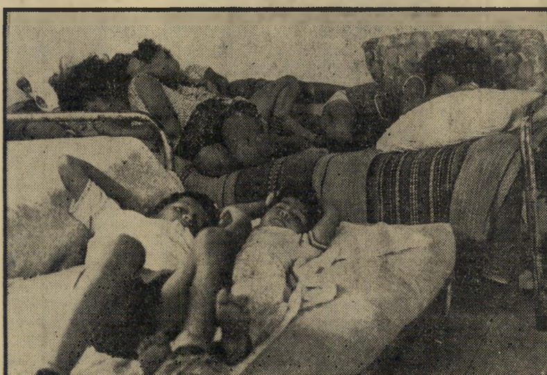
חדר השינה של משפחת שרפי

המאושר בשידורי ישראל. בשידור זה צויר בצבעים ריאליים מאד מצבה הכלכלי ה-מחרוז של משפחת שרפי בעיקבות השיר דוד שיגור אורחים בתים מכתבים נזעמים למערכות העיתונים שבתביעה שמוסדות צי-בוריים יצאו לעזרת אבי ה-22.