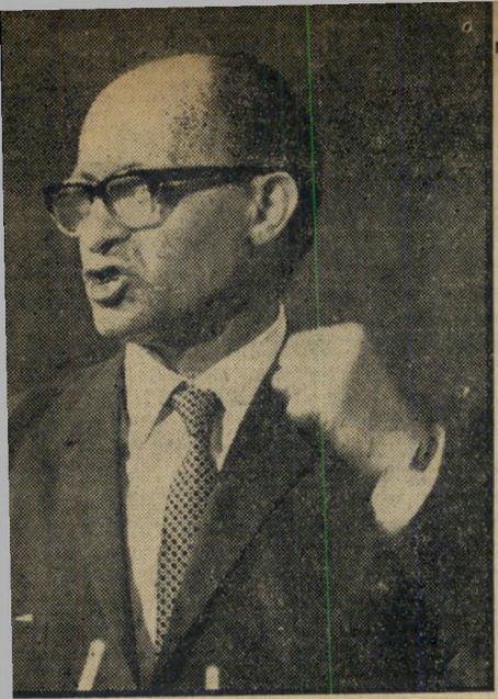
מנחם בגין — האיש שניצח