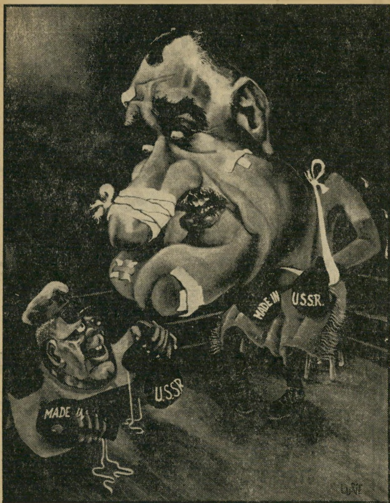
כפיפות חדשות קאריקטורה בצבעי שמן של לוריא, שפורסמה במקור בלייף, הועתקה אחר־כך לגדולים בעיתוני העולם, כמו הפארי מאטש.

השמש המצויירת, שהייתה את סמלו של רענן לוריא, והופיעה בכל הקאריקטורות שלו שפורסמו בארץ, זורחת מעתה בפיס' גת העיתונות העולמית.