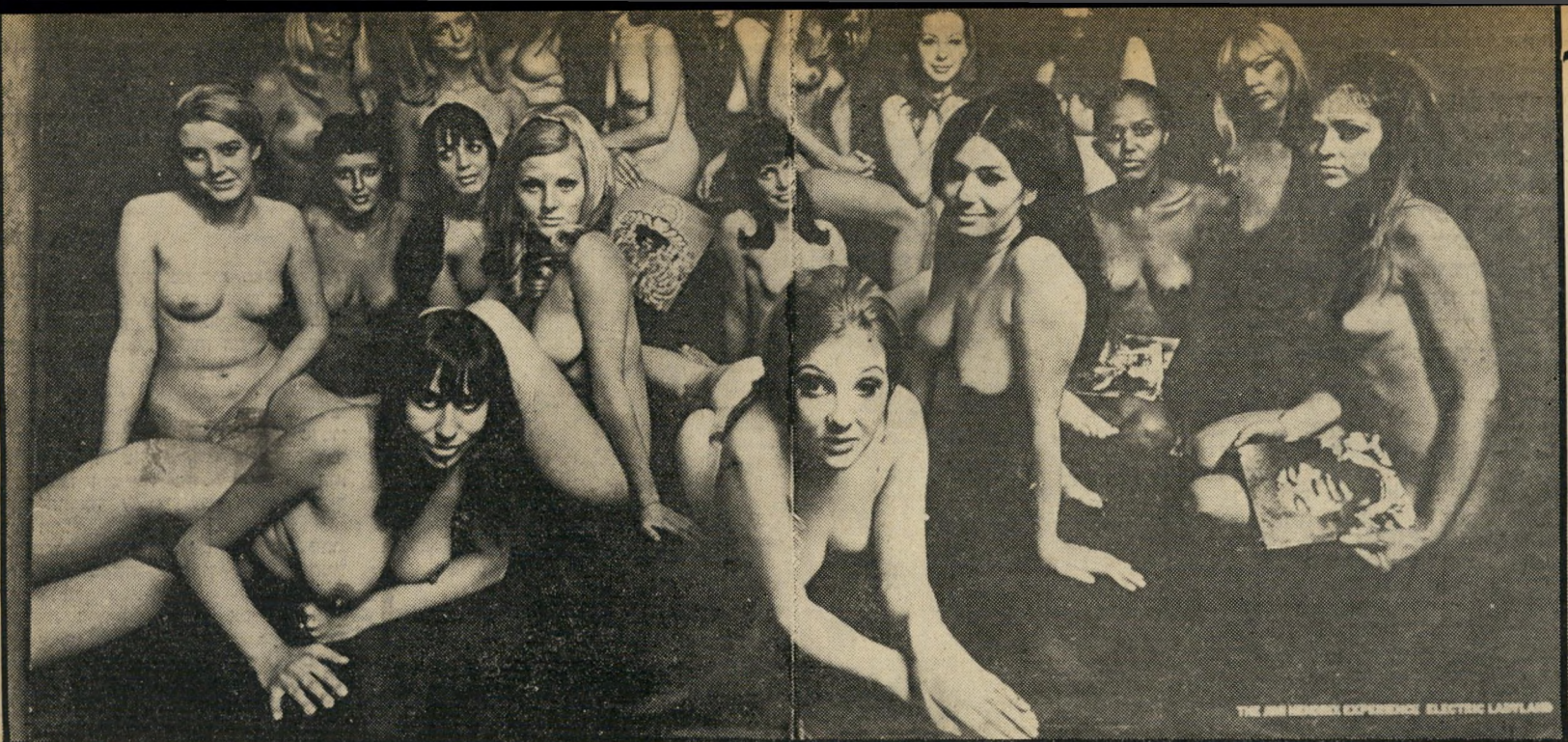
THE AMERICAN EXPERIENCE: ELECTRIC LADYLAND

החשמליות" הפך לאחת ההצלחות המסחריות של השנים האחרונות. להקת גורל עיוור הסעירה את דעת הקהל בארה"ב, כשהוציאה לשוק את תקליטה הראשון בעטיפה כפולה, שעליה התנוסס תצלום צבעוני של ילדה ערומה כבת 13 המחזיקה בידה מטוס צעצוע. אנשי הצניזורה הגועזים הורו להחרים את כל עותקי התקליט מהשוק, ומחירים של העותקים שנותרו בידי בעלי החנויות לאחר מבצע