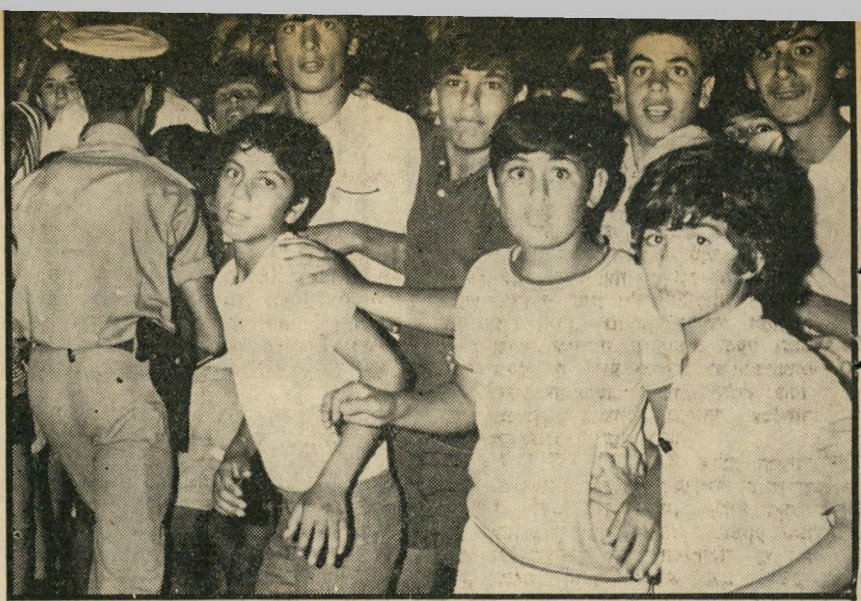
ידי אורייהודה ליד מקום הרצח מי יפרנס את היתומים?

לפני זמן-מה להשתתף בתוכנית רדיו ה-מקדשת לחג הסימנה נטשה — השבוע הקדוש — בו מעלים הנוצרים על נס את הייסורים שגרמו היהודים לישו. אלא שבקובות השתתפות הרב, נשתנתה מגמתה המסורתית של התוכנית, ויוזמיה, אנשידת נוצריים כולם, מצאו עצמם עוסי-קים, בדיון נלהב עם הרב היהודי על יציאת מצריים.