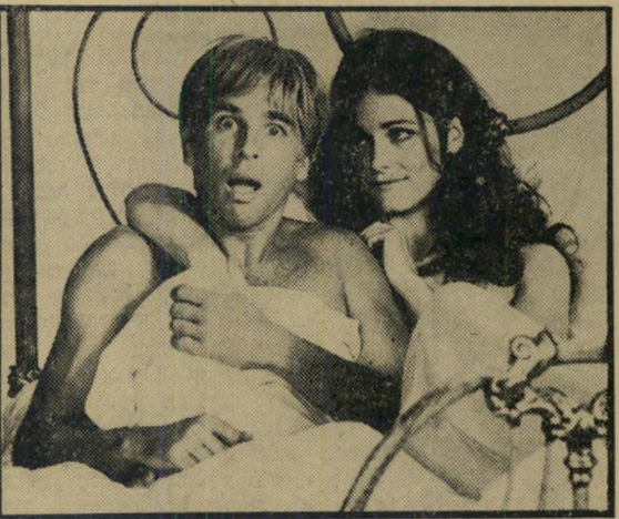
ברידג'ס: מה לעשות עם זה?

את שאר העובדות הוא לומד אצל הבוס שלו — העיתור נאי הדגול סאליבאן (בריאן קיט), שבשם הצדק והיושר מנצל את תמימותו, כדי לשלשל לכיסו מעות לא-כשרות.