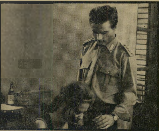
נרו וקארדינלה: מוות בצהריים

נרו לא מוכן להיכנע ולהסתגל לאווירה המקומית. הוא נלחם ומפסיד. חסרונו הגדול של הסרט אינו העלילה, אלא קלאודיה קארדינלה, שלא ברור בדיוק לשם מה המי-