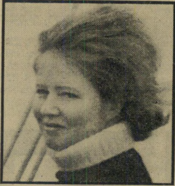
טבחית מקי הפירסומאית

זאת אולי הסיבה שמערכת הבחירות האחרונה באנגליה התנהלה בצורה לא כלי-כך שיגרתית. "אדוארד" הית ליווה את הנשים בחייו — רק בפסנתר, אמר תוך כדי מערכת הבחירות, אחד ממתחריו של הית, הרחק בן ה-56. אבל תוצאות הבחירות