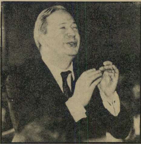
ראש-ממשלה הית — ובן הנגר

רות הראו שזה אינו עוזר: הית נבחר דווקא ברוב קולות של נשים. גם יריבו של הית, הארוולד וילסון, ניסה לרמוז כאילו הית הומוסקסואליסט: "איך יכול יהיה הית לשפוט על עליית המחירי רים? מי יספר לו בכמה סנטים עלו מחירי הביצים?"