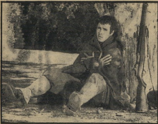
החייל היהודי: הפרוטקציה לא נעזרת

תוך כדי הרפתקאותיו של חייל זה, בעל אופי מלחמתי בערך כמו זה של שווייק, לועג ברי לשלטונות הצבא ומעלה באהדה רבה הווי של צעירים, שבעצם אינם יודעים מה בדיוק מצפים מהם, אבל לקרב בוודאי שאינם מוכנים,