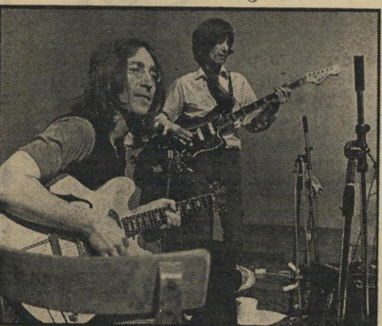
הריטון ולנון: יכור גם לא להיות

לאחר ששניים מתוך הארבעה, בוב וקארול, שינו את תורת החיים הזו עד תומה, הם ניגשים להגשמתה הלכה למעשה. למשל, כאשר מלצר אומר להם שהוא מקווה כי נחנו מן הארוחה, תוקעת בו קארול עיניים ושואלת: "האומנם זה באמת מה שאתה מתכוון לומר?" המלצר המבולבל בורח למטבח. ואילו בוב, בעלה, מרגיש צורך נפשי לספר לזוגתו כיצד נגד בה באחת מנסיעותיו, וזו, מלאת התפעלות מן הכנות ה"בלתי-מוסייגת" שלו, מודיעה שהדבר מקרב אותם אחד לשני, כי תרי הבגידה היתה פיסית בלבד, ואילו הוודוי הוכיח את האמון ההדדי העמוק השורר ביניהם. ומתוך הזדהות, בוגדת גם היא בו, כדי שיוכל גם הוא להוכיח את "הבנתו" ולחוש בקירבה הנפשית ביניהם. וכן הלאה וכן הלאה.