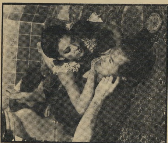
ווד וקלאף: התעלסות באמבטיה

בהתחשב בהריון הארוך שהיה לכל אחד מן התקליטים האחרונים של הלהקה, קשה להניח שהדברים התנהלו עד כדי כך על מי מנוחות. החלק המוצלח ביותר בסרט הוא ללא ספק המוסיקה. אבל לשם כך יש הרי תקליטים, ומסרט מצפים ליותר.