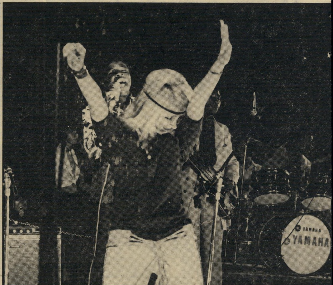
להקה ישראלית בפעולה