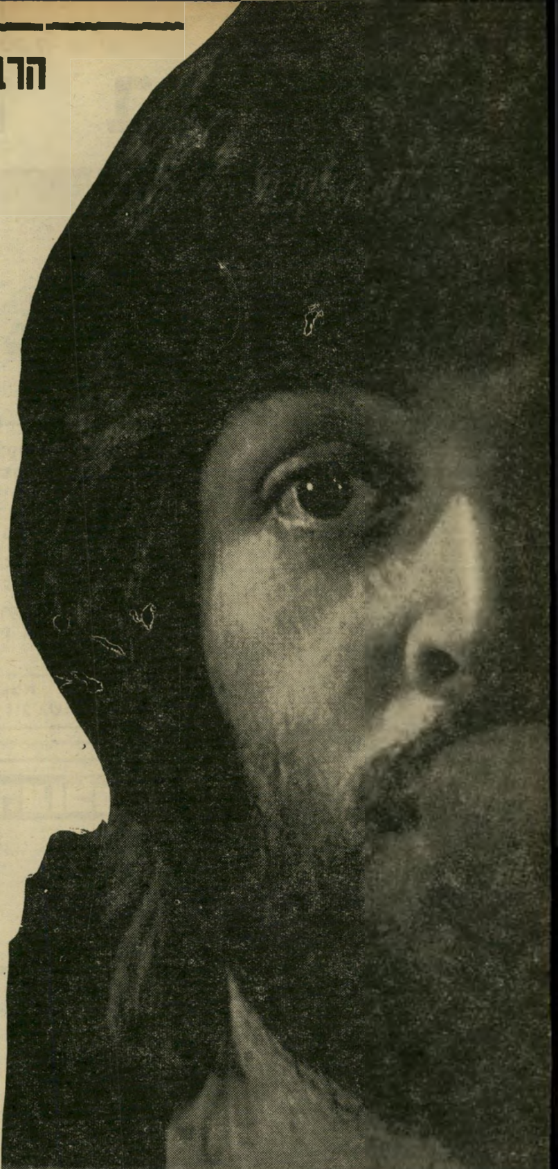
פול מקרטני יורשו של קרי גראנט

מ י שרועה להבין מה קרה לחיפושיות, ומדוע בעצם החליטו לפרק את המכונה היעילה ביותר לייצור כסף של המאה העשרים, שעה שהיתה עדיין בשיא הצלחתה, אינו צריך אלא לאזין לשלושה תקליטים חדשים, כולם מבוצעים על-ידי ארבעת המופלאים, אבל שונים זה מזה תכלית השוני.