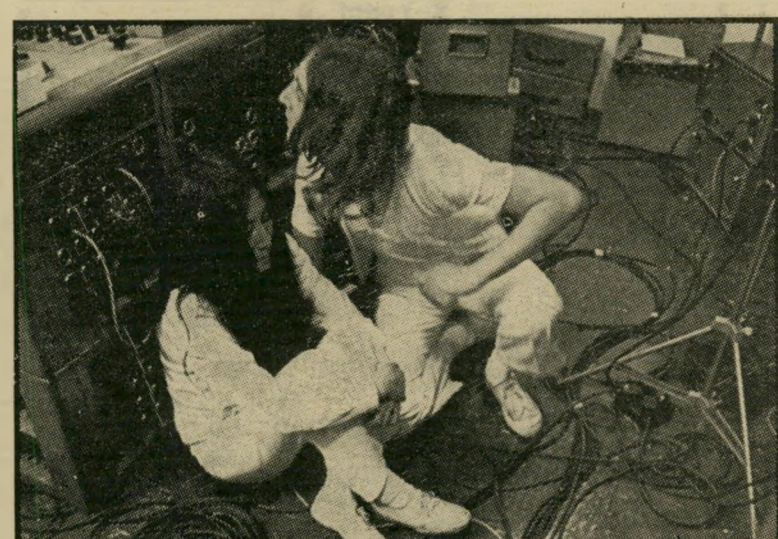
ג'ון ויוקו מלחמה למען השלום

לא התיימר אף פעם להיות זמר, בחר ל- עצמו אוסף של פיומנים ישנים ומוכרים, כמו גבעת האהבה, אבק כוכבים ועוד, בחר לעצמו כמה מן המוסיקאים הטובים ביותר משני עברי האוקיאנוס (קוינס ג'ונס, לס ריד, אלמר ברנשטיין, אוליבר נלסון ועוד), ויצא להוכיח שבעצם זמר אינו זקוק לקול כדי להצליח. מספיקה לו האישיות. במיק- רה של רינגו, הדבר נכון בהחלט.