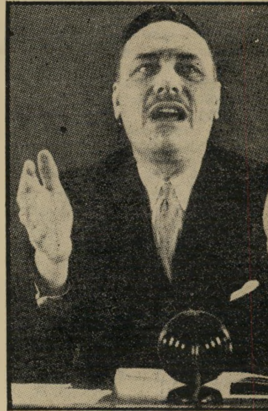
אנוך פאול זוג הייל

מנהיגי מפלגת השמרנים מוסיפים ממנו, מגיבים במבוכה על תעלוליו. אבל הם לא גירשוהו מן המפלגה — והיו מוכנים בהחלט