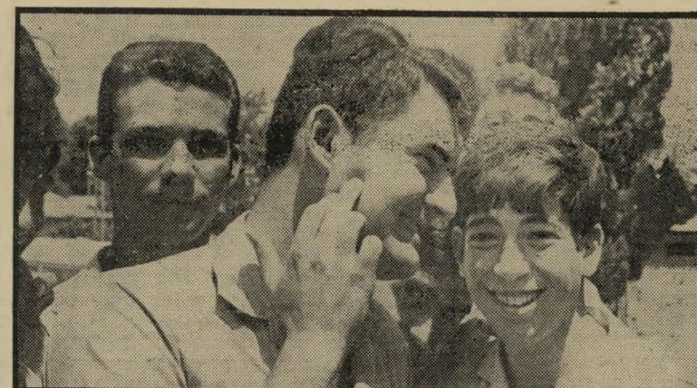
תלמיד מוסקוביץ אחרי התספורת מותר

"When the blood flows, the money flows," says a leading Zionist.