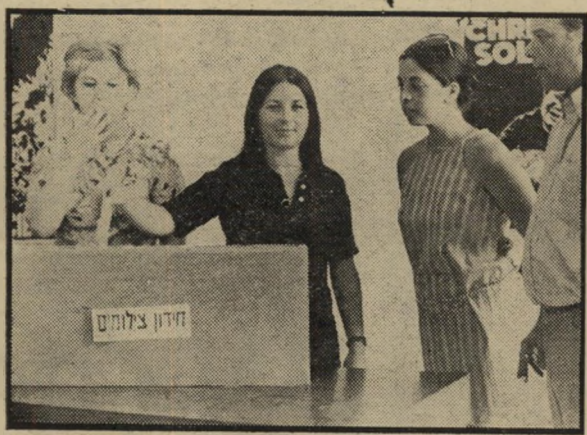
מזכירת המערכת מוציאה את גלויות הזכייה

ביום שלישי, ה-16 ביוני, נערמו בתוך חיבת-עץ גדולה, שהוצבה על אחד השולחנות במערכת, קרוב לשתי רבבות גלויות. היו אלו התשובות שנשלחו על-ידי סוראי העולם הזה לחידון הצירואים שפורסם בעיתון במשך שישה-עשר שבועות. בזמנו הבטחנו שהפרס הגדול בתחרות צילומים זו, כרטיס טיסה לפאריס, מתנת חברת אולימפיק אירווייס, יוגרל בין שולחי התשובות הנכונות לחידון בתחילת חודש מאי. לא יכולנו לעמוד בהבטחתנו זו. מיון התשובות נטל יותר זמן מהמצופה. מבין כל התשובות הנכונות שהוכנסו לקלפי ההגרלה, הוציאה