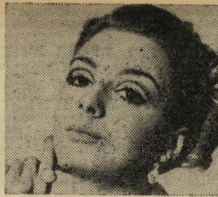
פעם אהיה שחקנית

בליל יום החמישי בשבוע שעבר, כאשר נערך במכסיקו משחק חצי הגמר המלהיב