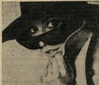
או מרגלת בינלאומית