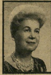
סופרת בורקו התניוק לא תורגם

דיירי הבית המשותף ברחוב הירקון 285 בתל-אביב, שיצאו להדרה-המדורגות לשמע הפועלים וחומרי הבניין שהועלו אל גג ביתם, לא הבינו מה הולך כאן. איש מהם לא הומין את הפועלים הללו.