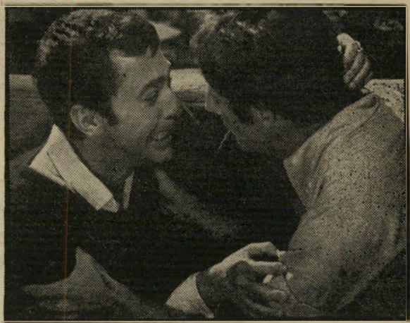
באמריקה: קומבס ונזסון

"אילו רק יכולנו לא לשנוא את עצמנו עך כדי כך..."