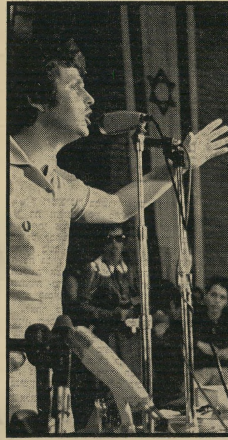
נואם בפני הסטודנטים וסטחי