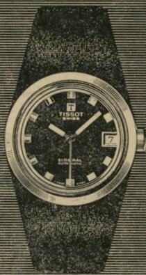
סידרל פיברגלס דגם קטן יותר. אטום למים. אוטומטי. עם תאריכון. עיצוב מהודר. המחיר: 120 ל"י.