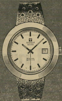
סידרל פיברגלס אטום למים. אוטומטי. עם תאריכון. המחיר עם רצועה: 110 ל"י עם צמיד: 145 ל"י