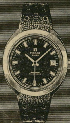
סידרל פיברגלס אטום למים. אלקטרוני. עם תאריכון. המחיר: 199 ל"י.