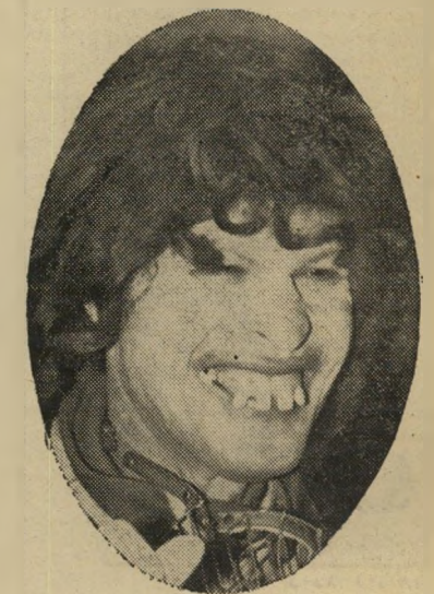
ד"ר יזהר חרוזי

איס חצי חיזוק. ואילו שותלי-לבבות הם חבריה עם הלב בחזק (הלב שלהם אני מתכוונת) תמיד שמחים וטובי-לב. אתם רוצים דוגמה? קחו למשל את המשתיל הגדול שבהם — כריסטיאן ברנארד. זה דומה לרופא זה? נו באמת. אתם הרי יודעים בעצמכם כמה הוא עליו. ביחוד אחרי שהוא התחתן עם אשתו החדשה בת 18.