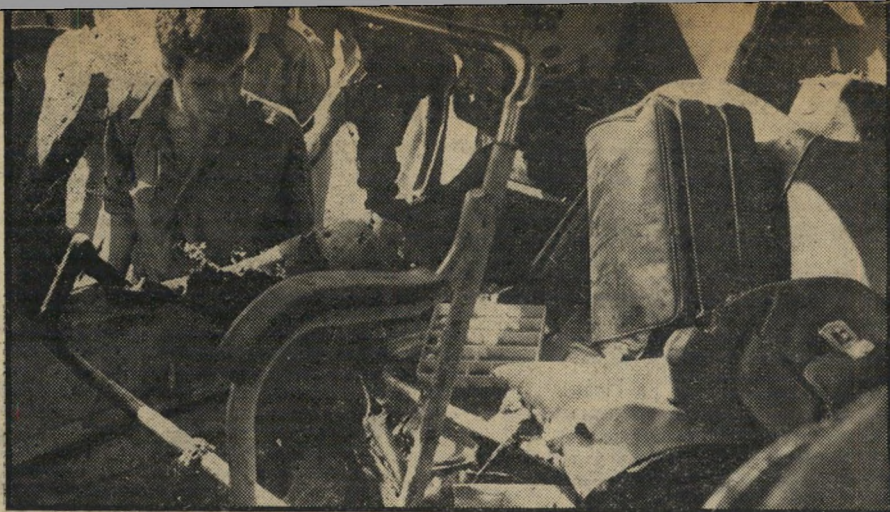
חיי התלמידים כך נראה, מבפנים, האוטובוס הפגוע: ילקוטי בית הספר, מושלכים על גבי ספסלי האוטובוס השרופים, כשלצידם מחברות שרופות.