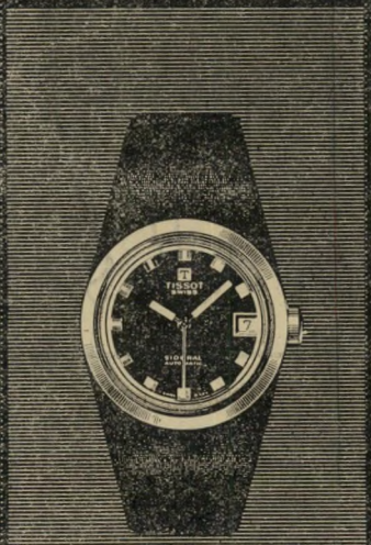
סידרל פיברגלס דגם קטן יותר. אטום למים. אוטומטי. עם תאריכון. עיצוב מתודר. המחיר: 120 ל"י