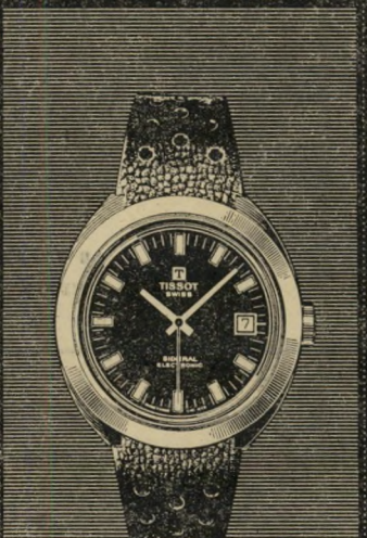
סידרל פיברגלס אטום למים. אלקטרוני עם תאריכון. המחיר: 199 ל"י