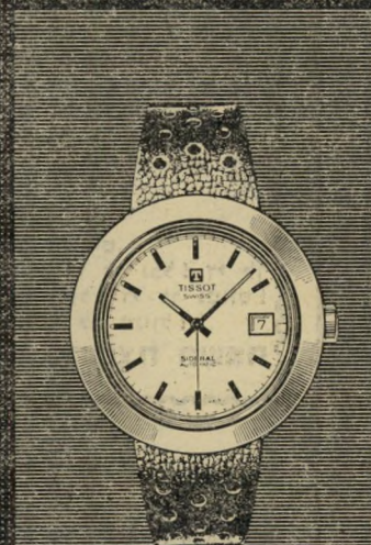
סידרל פיברגלס אטום למים. אוטומטי עם תאריכון. המחיר עם רצועה: 110 ל"י המחיר עם צמיד: 145 ל"י