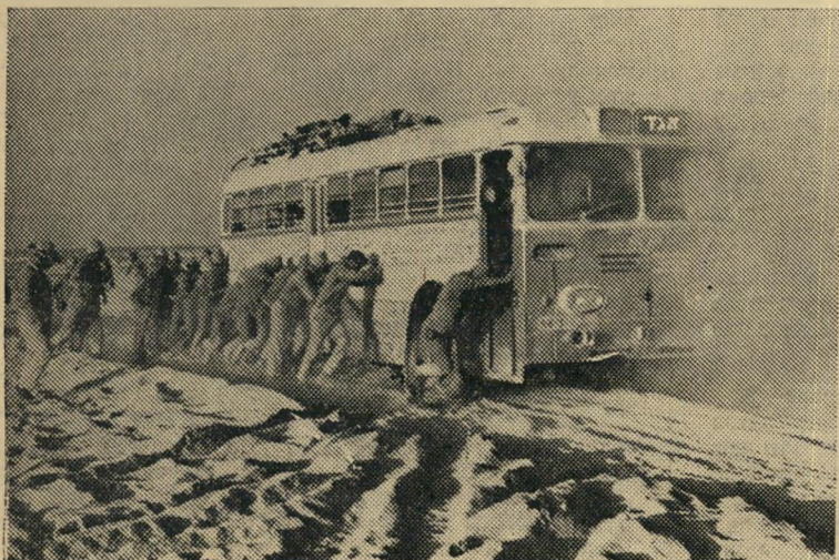
במלחמת ששת הימים שימשו האוטובוסים של „אגד” רכב קרב לכל-דבר. בתמונה: חיילים דוחפים אוטובוס בחולות צפון סיני

גם בימים שלאחר המלחמה נדרש „אגד” להקצות לצרכי הבטחון מספר