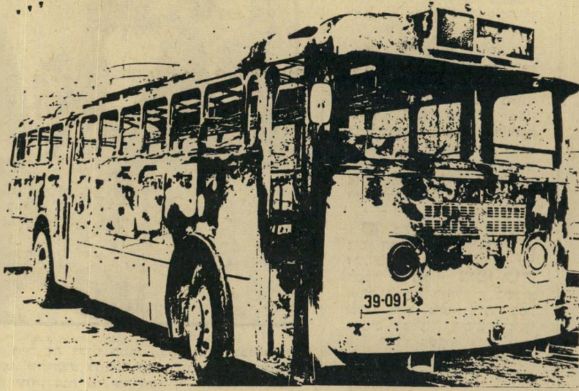
אוטובוס של „אגד” שנשרף על-ידי מתנקשים ברצועת עזה

ניהול המשק של „אגד” הוא מן היעילים בתחבורה הציבורית בעולם. מוטי סכי הקואופרטיב עובדים בשיטות ה„משוכללות ביותר והטיפול המונע ברכב הגיע לרמה כה גבוהה שכמעט אין תקלות מיכניות באוטובוסים. סוד הטיפול הוא ביקורת קפדנית וצעדים מוניחיים, החוסכים תיקונים לאחר מעשה. משום כך אין האוטובוסים של „אגד”