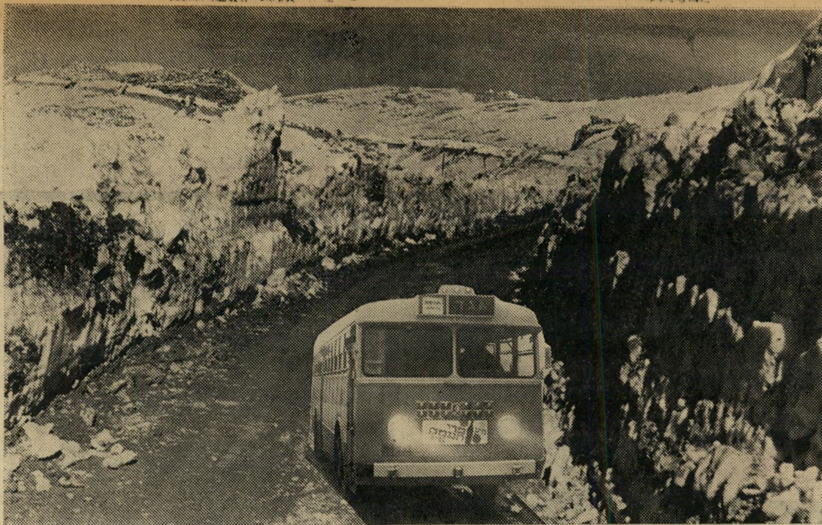
„אגד“ מקיים שירות סדיר לגולן ולחרמון

לפני שבועות אחדים, כשנדו-נה שאלת התעריפים בתח-בורה הציבורית, נעשה נסיון ל-השחיר את פניו של „אגד“ ול-הצגת מצבו ותביעותיו באור מסולף. המבקרים לא באו בטע-נות על טיב השירות ש„אגד“ מספק, לא הזכירו את התנאים שבהם פועל הקואופרטיב. בהיע-דר טענות ענייניות הם היכו מתחת לחגורה והשמיעו רמזים שונים, ללא ביסוס וללא הצדקה.