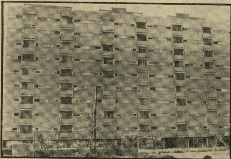
רבייהקומות ברחוב אלי כהן בבתיים הצינורות התפוצצו

מייד לאחר שנכנסו לדירותיהם, גילו מאה הדיירים החודשים שהם נכנסו לבוץ עמוק: