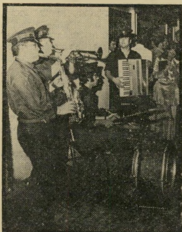
תזמורת מועדון "עינבר" איזה אורקסטרה

— כמו ששוחררו החשודים השונים בעשר הצעות של דיסקוטקים אחרים בעבר. אורחי הכבוד בפתיחת עינבר היו צוות