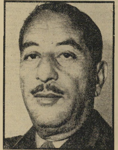
נשיא אחמד אל-אביכר היהודי נתלה על המאוורר

עוצרים את מי שרוצים. חיי היום-יום בעיראק אופיי פחד. מלבד שוטרי-תנועה, אין שוטרים ברחוב. במקומם סורי