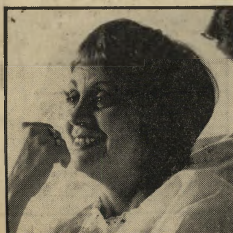
חנה מרון — החיוך