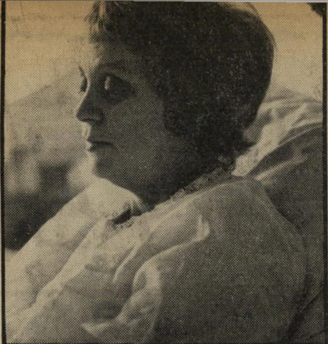
חנה מרון — הכאב

על שאלות אלה תצטרך התביעה להשיב בבית המשפט. ושוקרון? שוקרון החליט להפסיק בינתיים לקנות כרטיסי-פיס.