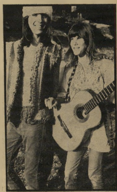
מאילת-לחופה סוני בת ה'70 הגיעה לירושלים ישר מאילת, הביעה עיסה את הגניסרת.

יתיה זו חתונה חסידית מורה מאוד: החדרים היו מלאים צעירים חוגגים. נערה יפה, לבושה שמלה ערבית ארוכה שהיתה פעם לבנה, ניגנה בגיטארה ושרה בהתלהבות חסידית אמיתית. על ברכיו של גבר צעיר ומזוקן, שניראה כאילו נילקח ישר מהמחוזר שיער, ישבה נערה במיני שהפריחה בועות סבון. בין בועה לבועה קלעה לו צמות בוקן. בחור לבוש סגול צחק ללא הרף כמו שליאפין בתפקיד פאר טט, בעליהבית המטירו נשיקות סוערות על כל אורה, שנכנס, בלי הבדל דת, מין וגזע. ובין נשיקה לנשיקה, עסקו בעליהבית בהכנות אחרונות, לחופה, כולל הכנת ה' מרק המסורתי, שנקרא ירושלים של זהב. לו היה נקלע לאותו מקום באותו רגע המומחה הגדול ביותר בעולם בשטח ה' חסידות — ספק אם היה עולה בדעתו ש' הוא נוכח בחתונה בחצר של רבי, ושכל ההיפייס שלגנו עיניו הם — החסידים.