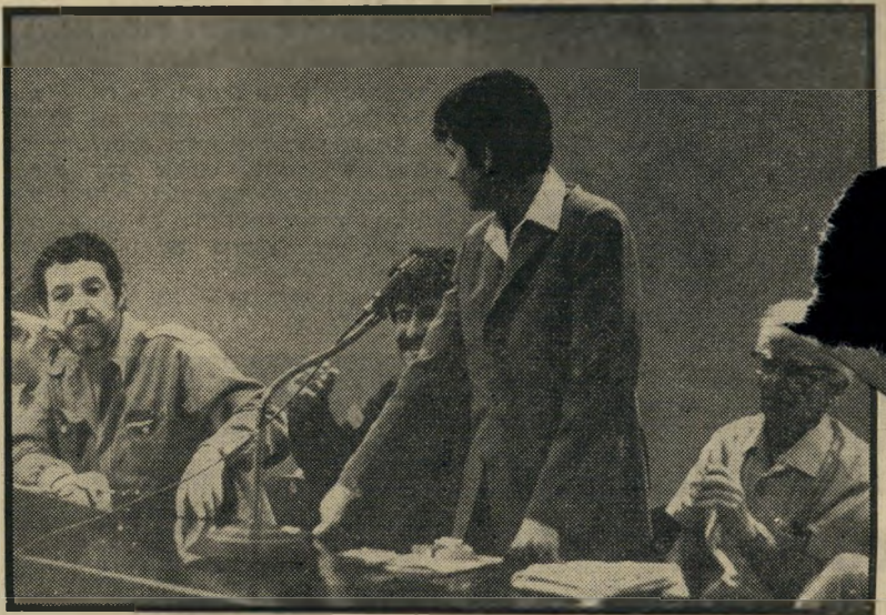
המשורר הערבי סמיר אל-קאסם במיפגש היהודי-ערבי