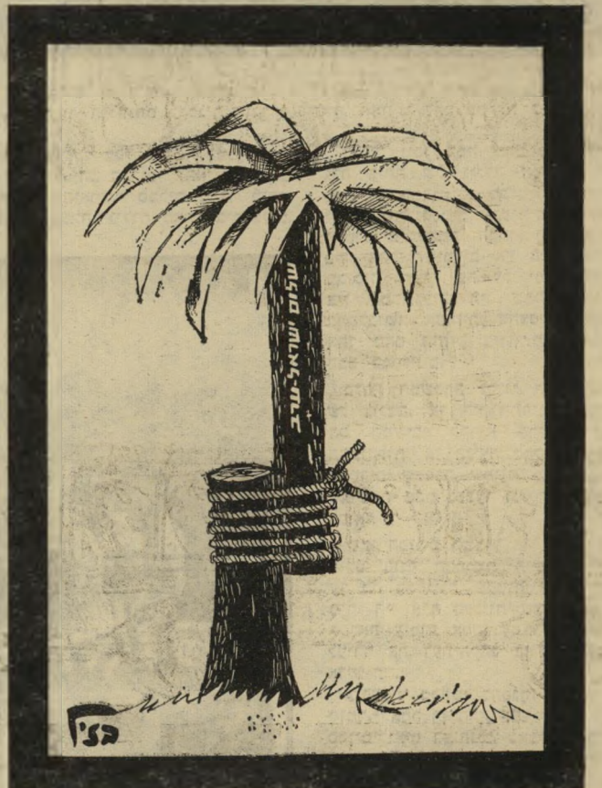
תוכנית סיסקו לשלום במזרח התיכון

אין להניח שהצעה זו תוכל לעמוד בפני התערבותו של בית-המשפט, באשר משתמעת ממנה הפרת זכותו של האזרח לשמור על דיעותיו ושייכותו הפוליטית — בסוד.